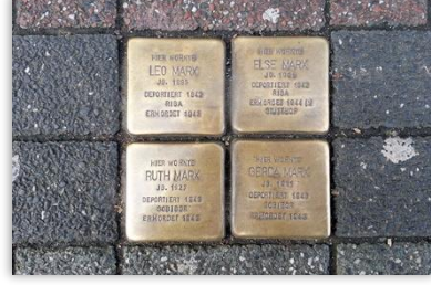
Stolpersteine (Tökezletme Taşları)

işaretlerinin ortaya çıkmasına yardımcı olabilir. Belki vicdanında ve gözünde bir dikene dönüşebilir. Gelin biz de 'tökezleten taş' yerine 'vicdan taşı' ya da 'vicdan dikenini' diyelim. Ya da herkes kendine göre bir isim, bir kavram düşsün.