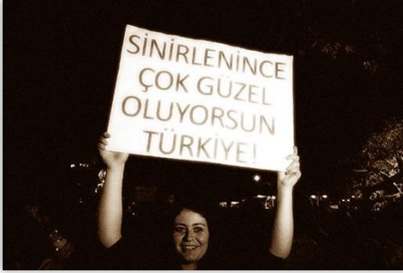
Gezi Parkı Eylemlerinden Bir Görüntü

Türkiye'nin siyasi geleneğinde (galiba başka gelenekleri de böyle) her şeyi bir yerlerden beklemek fazlasıyla sorunlu bir durumdur. Hatta bu