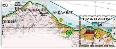
Yeşil Yol Projesi

Geriye doğru bakınca (Türkiye'nin birçok başka yeri gibi) çeşitli açılardan mahrum olan Artvin, önümüzdeki dönemde (eğer madenlere rağmen ayakta kalabilirse) daha da önemli bir yer olacak gibi görünüyor. Ağrılıkla küresel ısınma şeklinde ifade edilen dünyadaki iklim değişikliği, ekolojik dengenin bozulması, okyanusların bile tahminlerin ötesinde bir kirliliğe maruz kalması benzeri sayısız nedenle dünyanın suyunu çıkararak insana doğanın verdiği cevaplar da dozunu artırarak gündeme gelmekte. Bir insan ömründen çok daha kısa bir sürede, İstanbul ve New York gibi metropoller dahil dünyanın epey bir bölümünün sular altında kalacağı artık kabul edilen bir öngörü. Birçok yer sular altında kalırken bir yandan da ciddi su sorunları gündeme gelmekte. İşte bütün bu nedenler göz önüne alındığında coğrafi konumu itibariyle Artvin hemen her yanıyla yaşamaya elverişli sayılı yerlerden biri olacak gibi görünmekte. Bir örnekle düşüncemi açıklamaya çalışayım. Son yıllarda Karadeniz bölgesindeki yaylaların 'Yeşil Yol' adlı tuhaf projeye birleştirilmesi sadece bir çevre sorunu olarak algılandı. Oysa bu bölgede büyük topraklar satın alan birçok petrol zengininin basit bir yatırım yapmadığı, ileride sular altında ve susuz kalacak topraklarında tükenecek hayat koşullarının buralarda devam ettirilmesine yönelik bir hesap olduğu düşünmek için epey neden bulunmaktadır.