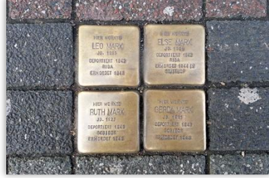
Stolpersteine (Tökezletme Taşları)

işaretlerinin ortaya çıkmasına yardımcı olabilir. Belki vicdanında ve gözünde bir dikene dönüşebilir. Gelin biz de 'tökezleten taş' yerine 'vicdan taşı' ya da 'vicdan dikenini' diyelim. Ya da herkes kendine göre bir isim, bir kavram düşsün.