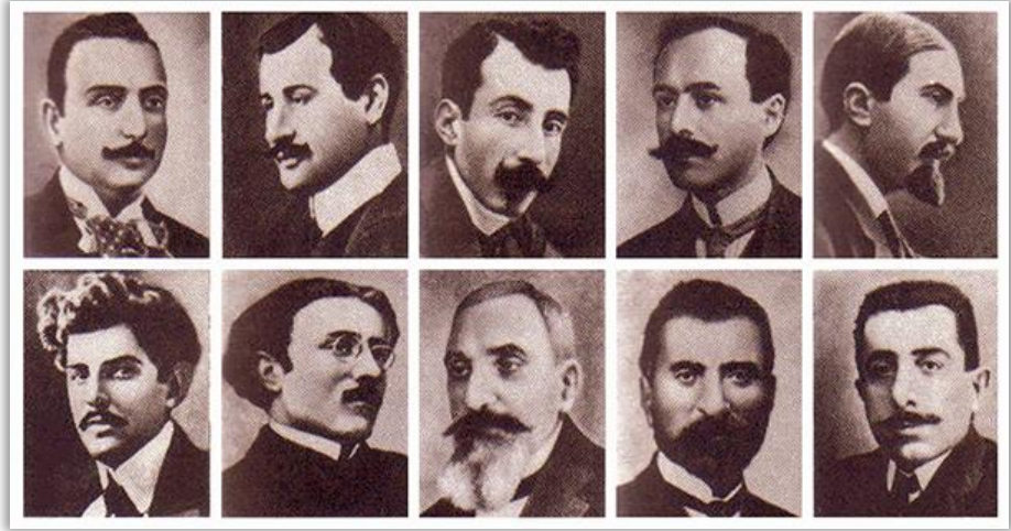
24 Nisan 1915'te Tutuklanan Ermeni İleri Gelenlerinden Bazıları

24 Nisan 1915 tarihi, Ermenilerin bazı ileri gelenleri ve aydınlarının tutuklanarak, sonrasında çoğunun yok edilmesi nedeniyle soykırımın başlangıcı olarak kabul edilir.